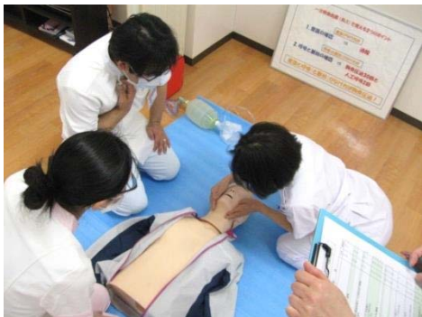
BLSチームによる一次救命処置講習会