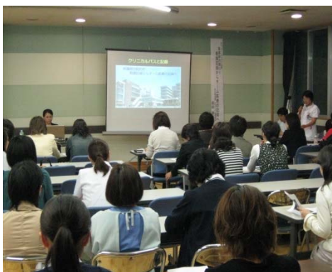
クリニカルパス委員会による 外部講師を招いての講演会

上記委員会をはじめ各種活動が、病院の運営を支えています。 当院では、院内のさまざまな取り組みにたくさんのスタッフが関わりを持っています。 スタッフのひとりひとりが仙台循環器病センターそのものなのです。