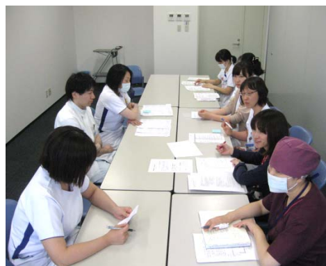
リスクマネージャーによる 定例ミーティング 具体的な 医療事故防止対策を検討