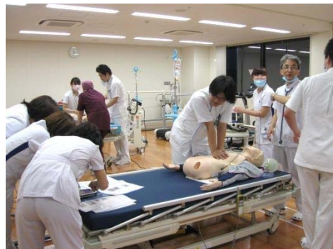
ACLS（医療従事者向け救急 蘇生のトレーニング）